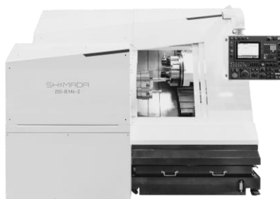
2SI-8 Mk- II ×600