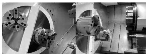
↑加工中にもう一つの主軸でワーク着脱