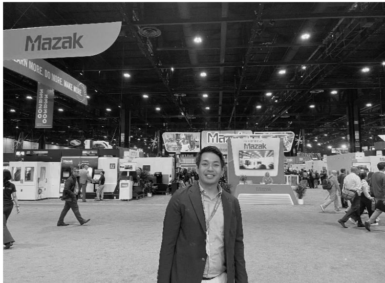
2024年9月に米国・シカゴで開催されたIMTS2024会場にて。